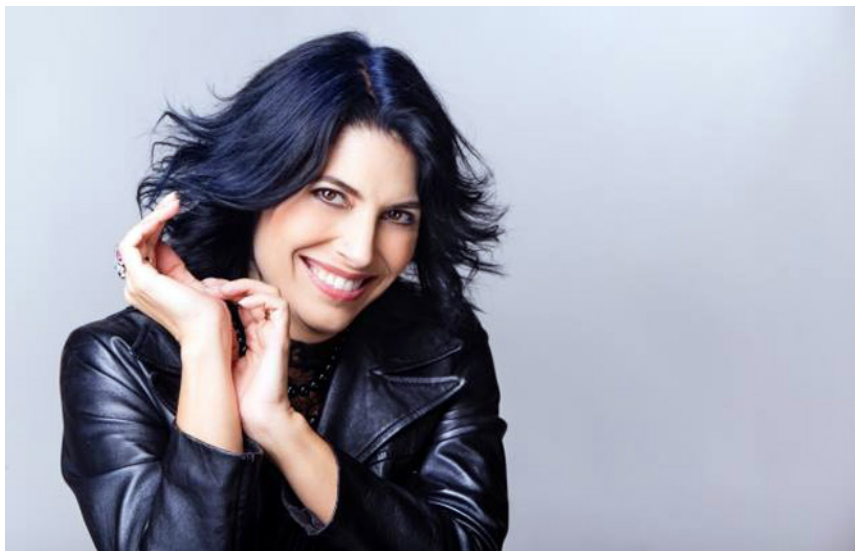
Vivica Genaux

Redacció on 29 novembre, 2017 / 0 comments