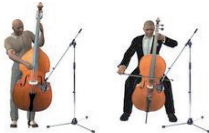
Un contrebassiste et un violoncelliste

Assis pour le violoncelle et debout pour la contrebasse car elle mesure entre 1 mètre 60 et 2 mètres