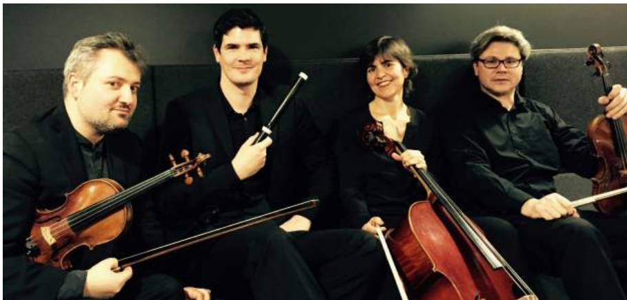
La Quatuor se produira dimanche 24 avril au Salon aux Gypserie - © Musiciens du Louvre

Publié le 14 avril 2016 à 09h52 | Modifié le 14 avril 2016 à 11h41 | Vu 261 fois