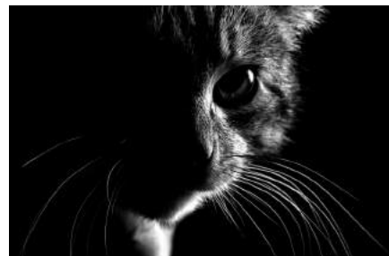
Noir et Blanc