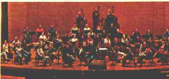
羅浮宮音樂家古樂團在香港只演出一場。