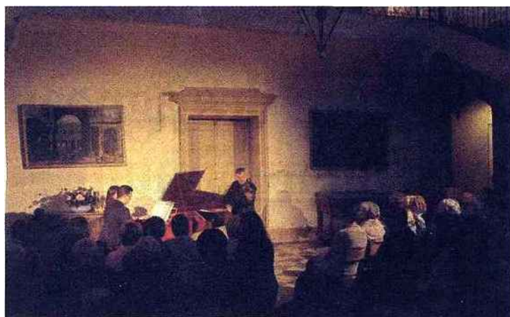
Les formations de musique de chambre permettent à l'orchestre grenoblois de se rendre au plus près de ses publics.

baroque, classique et romantique, ses musiciens jouant le plus souvent avec des instruments d'époque. Les Musiciens du Louvre de Grenoble restent une formation atypique dans le paysage des grands orchestres français. Cette structure légère, qui n'emploie que cinq musiciens permanents, les autres étant intermittents ou invités, fonctionne en grande partie grâce à sa billetterie, qui représente 70% de ses recettes. Elle a aussi, depuis trois ans, quelques mécènes, peu nombreux, mais fidèles, lui garantissant 5% de son budget. Enfin, les collectivités, Etat, conseil général, conseil régional et ville de Grenoble permettent à cet orchestre de proposer des prestations hors de ses salles