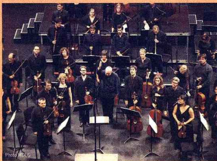
Les Musiciens du Louvre Grenoble sont un orchestre évolutif.

Quant aux Musiciens du Louvre de Grenoble, ils sont le premier orchestre français invité à se produire au Staatsoper de Vienne en Autriche. Ils ont effectué, en début d'année, une vaste tournée en Asie où ils ont pu prendre la mesure de leur renommée internationale. En 2014, ils seront à nouveau en Allemagne, en Suisse et en Autriche pour interpréter la Messe en Si de Bach ou en Belgique où se